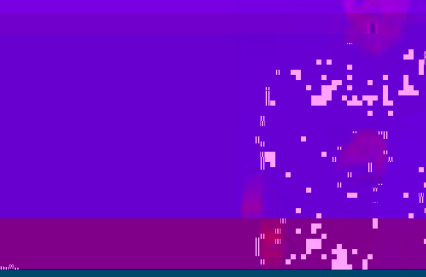
党委书记朱善璐到教育学院调研

养工作等方面，详细了解了学院的发展现状，并就如何进一步发挥教育学院的引领作用，推动学校教育教学改革，提高人才培养质量，促进学校内涵建设，实现“十二五”发展目标，提出了明确要求。朱书记强调，教育学院作为学校的重要职能部门，要紧紧围绕学校中心工作，主动服务、积极作为，为学校的改革发展和人才培养做出更大的贡献。